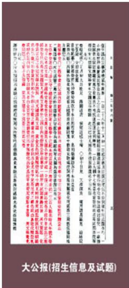
北洋工艺学堂的招考试题在《大公报》上刊登

考试也很独特，汉文主要是写作，相当于现在写的论文，题目是《化学为制造之根本》，要求考生能略举其说。汉文译英文也与化学科学相关，其中有一段话是这样的：“黄金其色纯黄，触空气不生锈。其纯粹者质颇柔软，可展引为细线，为金